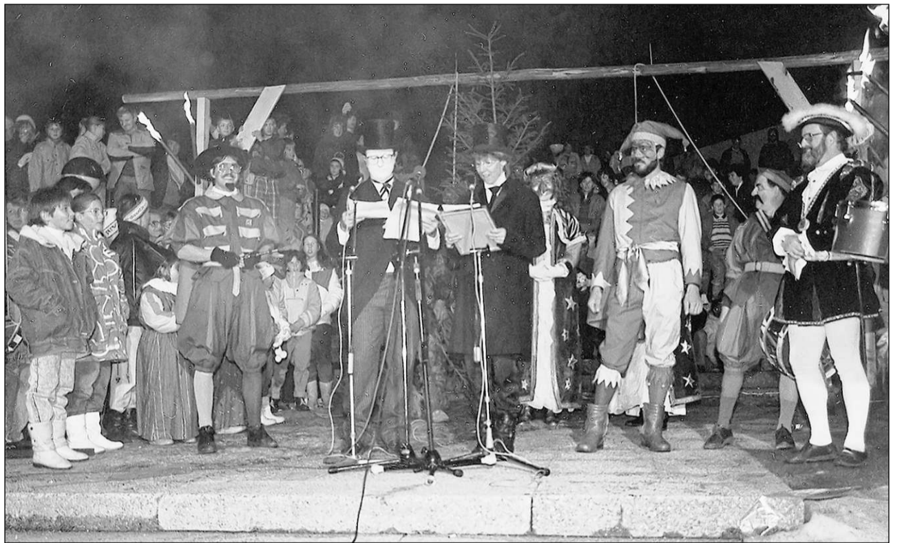
A Mustér è l'usit da la dretgira nauscha renaschi il 1989.

Grazia a lur forza electorala e a lur impurtanza militar eran las cumpagnias da mats politicain fitg pussantas, e grazia a